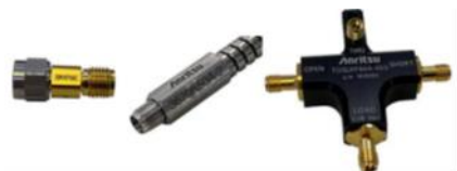
CALキット、テストポートケーブルなど